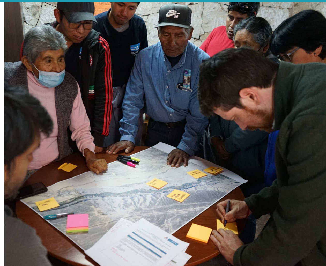
Segundo grupo de la mesa técnica con la comunidad de Lasana

Los participantes destacaron la protección de petroglifos, canales de riego en piedra, el Camino del Inca y sectores de Los Perales y Canal Pona, identificándolos como elementos relevantes en el paisaje que también se asocian a relatos como la Campana de oro. Además, se identificó la posibilidad de extender el pueblo hacia el campamento como futuro asentamiento ante las posibles lluvias que afecten a las viviendas. Por otra parte, se mencionó la formación de microbasurales debido a la restricción por quema de basura, que tradicionalmente se quemaba todos los años y el rechazo a la construcción en terrenos agrícolas.