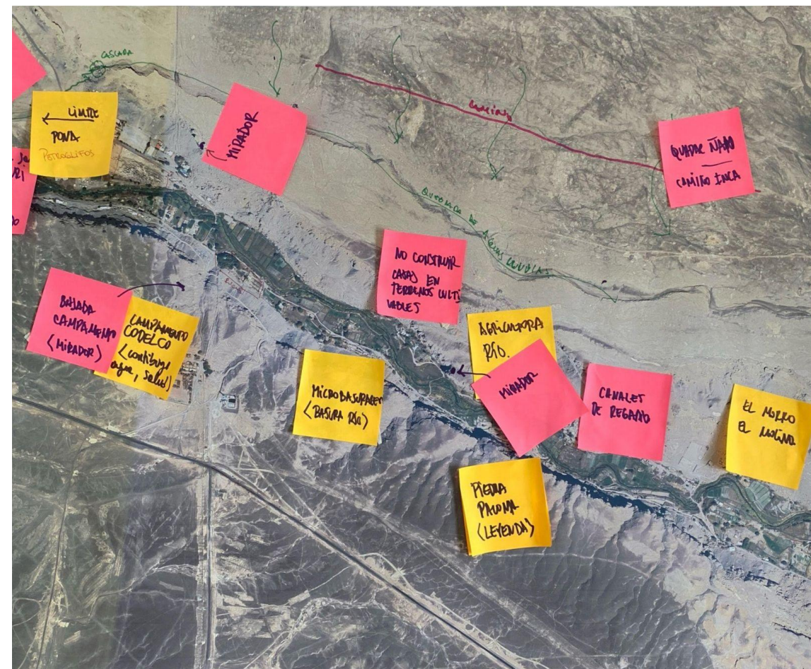
Resultado grupo 2 de la mesa de trabajo