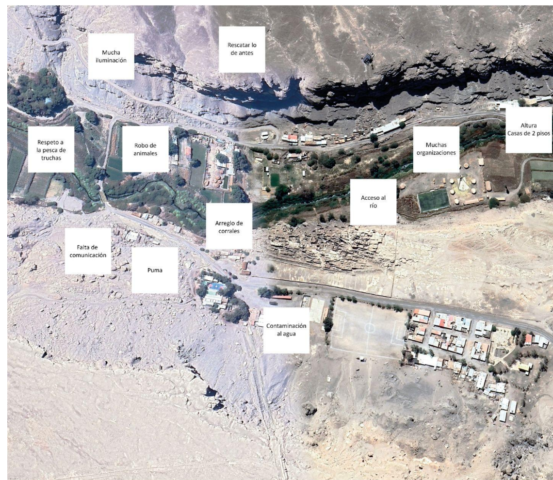
Resultado grupo 1 de la mesa técnica