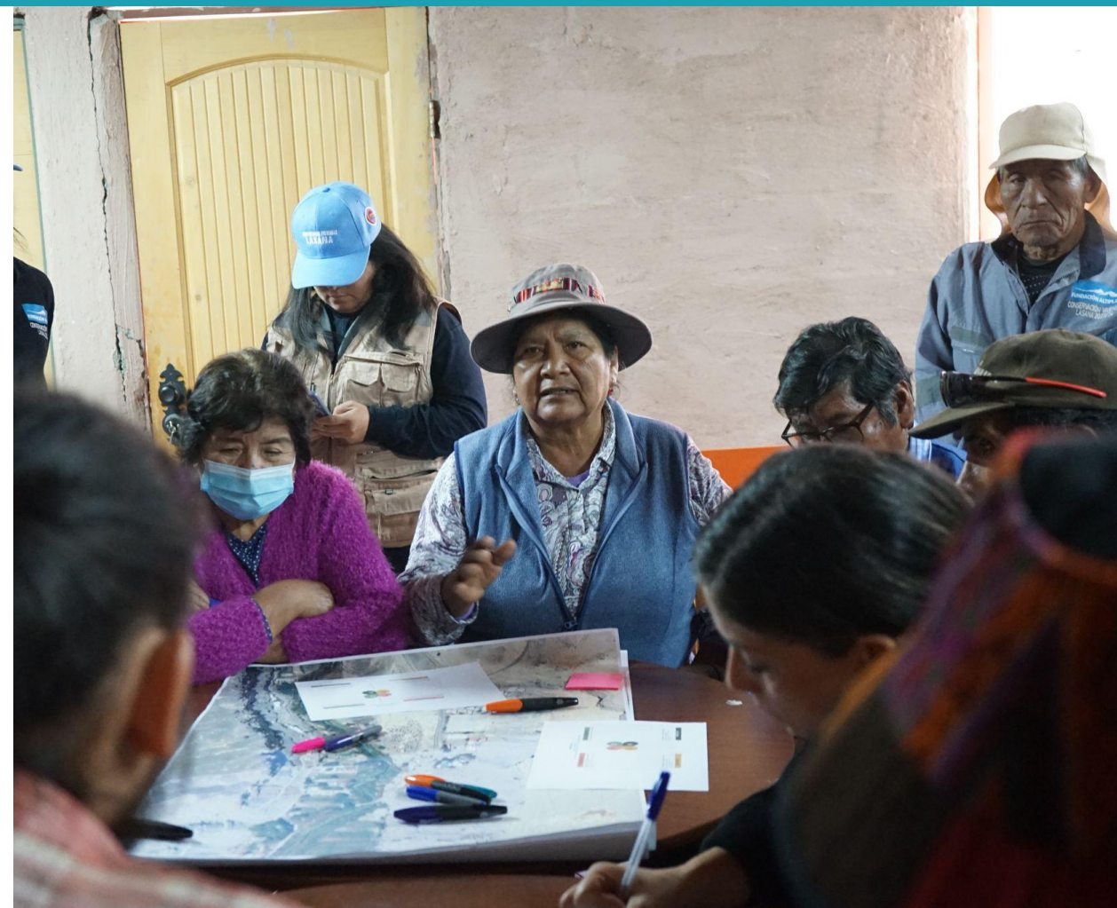
Primer grupo de la mesa de trabajo con la comunidad de Lasana