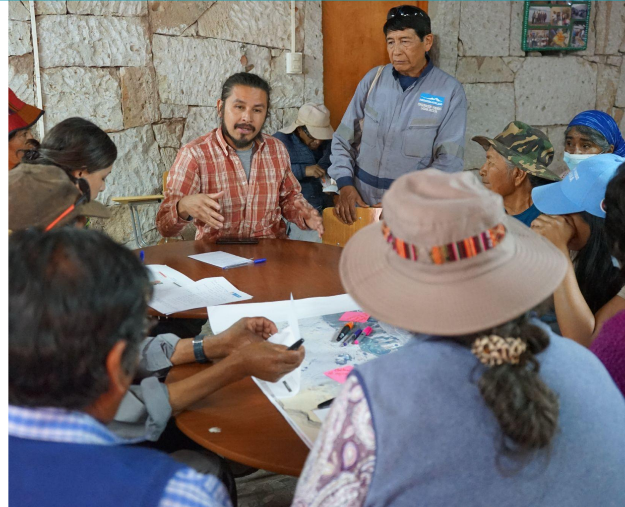
Primer grupo de la mesa técnica con la comunidad de Lasana.

También se mencionó la contaminación del agua debido al óxido de las mineras, afectando en la siembra, la cual también se ha visto afectada con el ingreso de visitantes a los sembrados que se encuentran fuera del pueblo. Por otra parte, tomó relevancia la contaminación lumínica en el sector y la intención de rescatar el estilo tradicional del pueblo y sus casas, haciendo referencia a la problemática de las construcciones de dos pisos por parte de algunos habitantes.