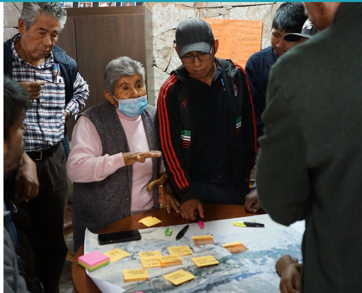
Mesa Técnica con la comunidad de Lasana en el Taller de Normativas

Con la experiencia de los relatores, los comuneros participantes podrán recoger las diferentes ideas y sugerencias que se han conseguido en otros lugares y que son aptas para aplicarlas en Lasana.