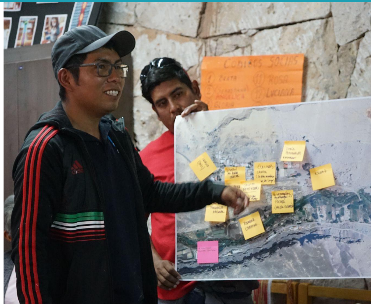
Exposición de resultados por cada grupo

Los relatores hacen el compromiso de entregar un resultado de la actividad realizada en donde se le dará una propuesta a la comunidad según las ideas más representativas y respuestas más destacadas de los participantes, las cuales pueden contribuir a la elaboración de un manual de normativa y resguardo patrimonial.