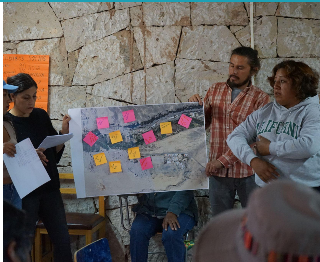
Exposición de resultados por cada grupo

acceso visitantes habitantes viviendas contaminación proteger basura tradicionales río comunidad conciencia iglesia animales pueblo heladas casas materiales técnicas