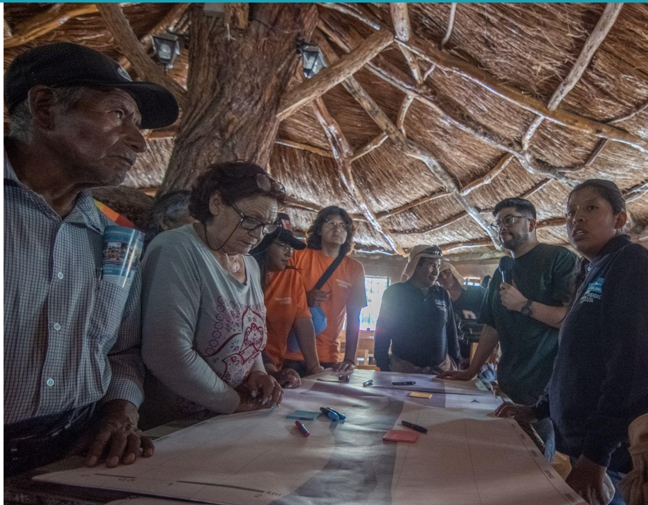
Taller participativo con un mapa de Lasana para la identificación de lugares patrimoniales reconocidos por la comunidad.

El levantamiento de información que se obtiene en la confección de este mapeo permitirá que la comunidad posea la información para poder gestionar los recursos que le permitirán el resguardo de los tesoros patrimoniales existentes en su territorio.