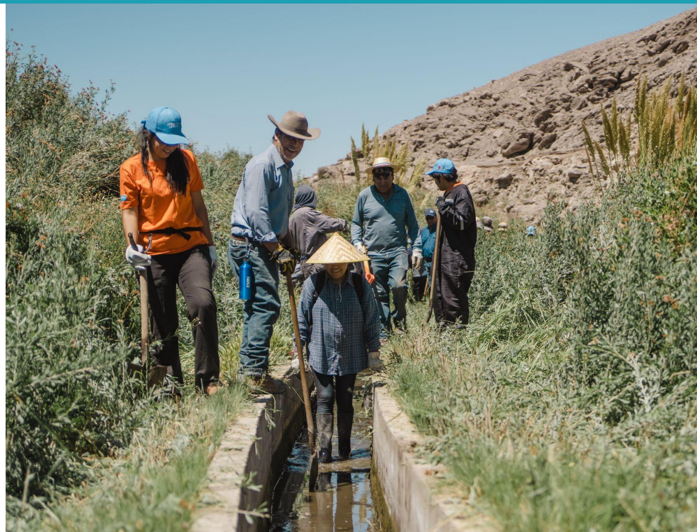
Apoyo en la Limpia de Canales con la Comunidad Indígena

La actividad de la Limpia de Canales, es una de las tradiciones más importantes de la Comunidad. En esta actividad los regantes se reúnen con el propósito de limpiar y mantener el canal de regadío para que el agua pueda fluir sin ningún estancamiento producto de la basura que se acumula en el canal, como consecuencia del clima, los desechos que eliminan los turistas en el canal o simplemente por algún deterioro que presente la acequia. El propósito fundamental de esta limpieza es aprovechar mejor el caudal de agua para los cultivos a través del riego por inundación. Además, se aprovecha este momento de compartir en Comunidad, a través de costumbres específicas para esta ocasión. En esta primera Limpia del Canal Pona, Fundación Altiplano estuvo presente con la asistencia de su Equipo, además de sus maestros quienes apoyaron con mano de obra en esta labor comunitaria y pudieron vivir junto con los comuneros esta experiencia tradicional y conocer la importancia que tiene el agua para la agricultura en este territorio.