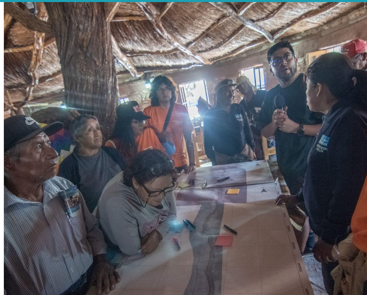
Taller participativo con un mapa de Lasana para la identificación de lugares patrimoniales reconocidos por la comunidad.